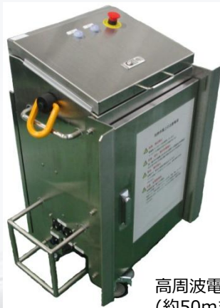
高周波電源装置 (試作モデル) (約50mまで延長可能)

足場等の狭隘な場所で実施される鋼橋の塗装剥離作業に配慮した塗装剥離装置(試作モデル)です。