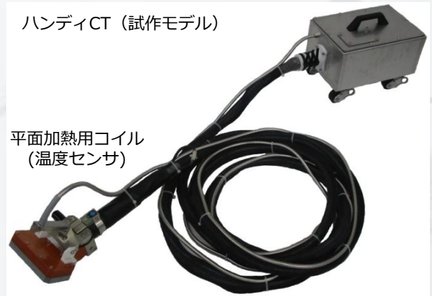
平面加熱用コイル (温度センサ)