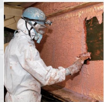
剥離剤による塗膜剥離作業